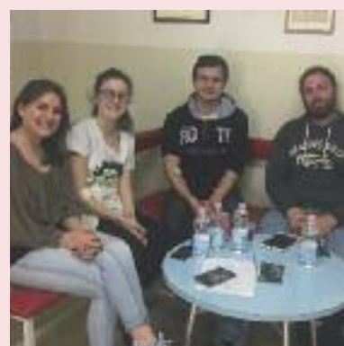
Tanti giovani nelle Valli sono donatori