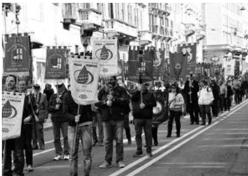
Il corteo congressuale per le vie di Milano.

Mentre si svolgevano i lavori la comitiva partita da Udine ha raggiunto Monza con una prima tappa nel caratteristico locale parte del convento di uno dei patroni della città, San Gerardo de Tintori. Con la bravissima guida reclutata per l'occasione Elena Riboldi ci si è recati alla cappella dell'espiazione, il luogo ove l'anarchico Bresci nel 1901 compì l'attentato contro il re Umberto I uccidendolo. Dopo una minuziosa visita immancabile è stata la visita al Duomo, alla cappella della regina Teodolinda che custodisce la "corona ferrea" con la quale venivano incoronati i re d'Italia nell'antichità e contenente un chiodo della croce di Cristo. Dopo aver scoperto tutte le bellezze del Duomo, la curiosità ci ha spinti a cercare il famoso convento della monaca di Monza, del quale ora rimane solo la