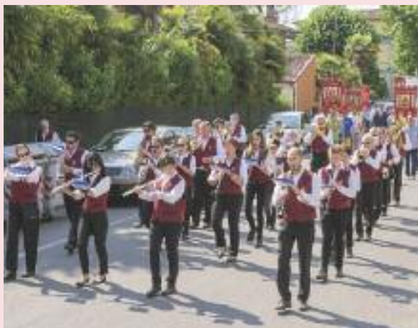
Due momenti della "Giornata del donatore" a Fiumicello.