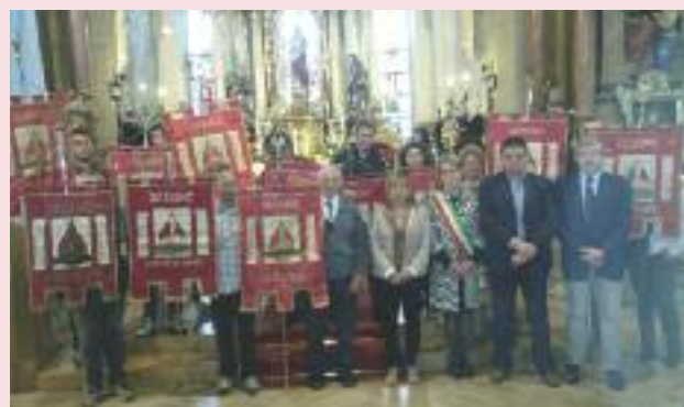
Al termine della S. Messa labari e autorità.