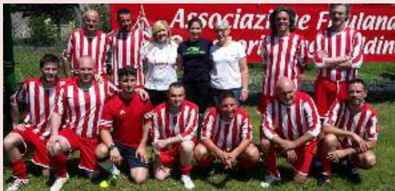
La formazione del afdsudovest.