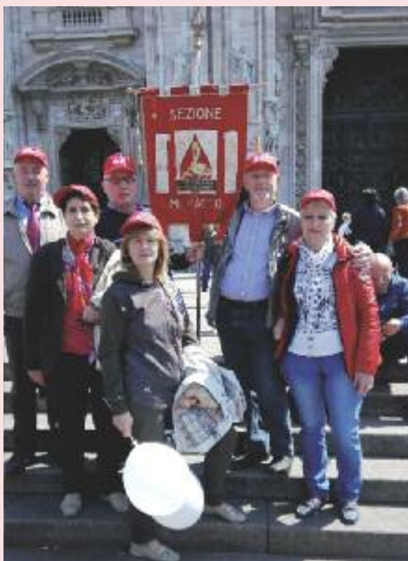
Rappresentanti dell'AFDS - Sezione di Moimacco al Congresso Nazionale a Milano

"L'associazione attraverso queste e altre iniziative si augura di sensibilizzare gli individui, soprattutto i giovani, per incrementare così il numero dei donatori, con la speranza che più persone vogliano cominciare un percorso di consapevolezza, solidarietà e salute. Il ringraziamento mio e di tutta la Sezione è rivolto a coloro che sostengono il dono come un impegno serio e costante" queste le parole del Presidente Vicenzutti.