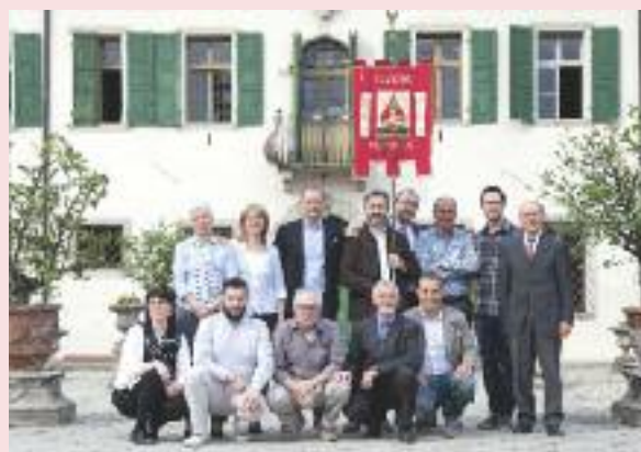
Nuovo consiglio AFDS - Sezione di Moimacco