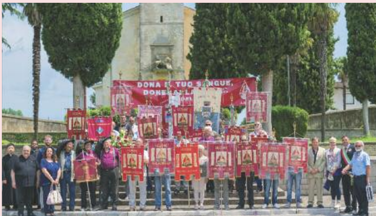
Donatori e labari in festa a Teor.