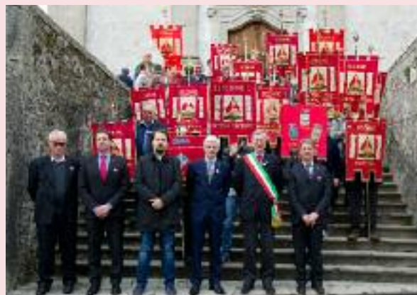
Il gruppo dei labari con le autorità.