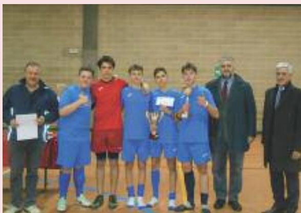
Dai un calci all'indifferenza, quello è il messaggio da Carlino.

Domenica 12 marzo si è svolta la prima edizione del torneo a calcetto intitolato "Dai un calcio all'indifferenza". L'iniziativa portata avanti dai donatori di sangue AFDS della sezione di Carlino, ha come obiettivo primario quello di sensibilizzare i ragazzi verso tematiche come la solidarietà ed il volontariato e quello secondario in un momento "sano" di competizione dove valori importanti come il "fairplay" possano essere evidenziate e valorizzate al meglio. Sono davvero rare le occasioni come queste, afferma il Presidente di sezione Damiano Franceschinis, dove i ragazzi possano non solo competere in uno spazio sano ma dove si possono sentire veramente protagonisti di un'