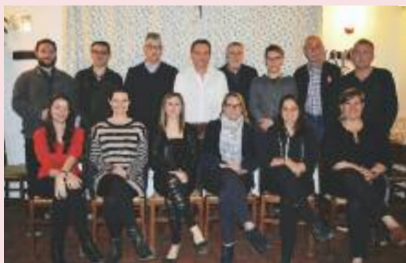
Il Consiglio Direttivo di Buttrio per il 2017.

prio paese; come la giornata ecologica per ripulire le strade e i campi del territorio o la 30esima edizione dell'annuale marcia Cognossi par Cognossisi del 1° maggio, dove hanno partecipato e aiutato alla realizzazione dell'evento.