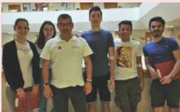
I donatori del Zanon Deganutti alla prova del Dono.