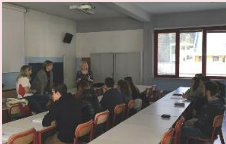
Un momento dell'incontro per il progetto "Fratello Genetico".