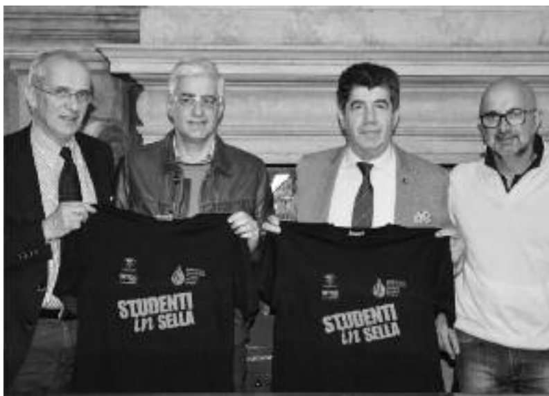
Il Presidente Flora alla presentazione dell'iniziativa.

«Abbiamo cercato di creare qualcosa che insegni ai ragazzi cos'è la fatica, cosa sono le salite nella vita, un momento in cui conoscere se stessi e gli