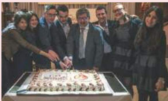
Giornata del Dono al ZanDeg.

Dopo aver chiuso il 2016 con 524 donazioni, superando il traguardo delle 500 per il settimo anno consecutivo, a fronte di 700 iscritti dei quali 480 attivi per donazioni, la sezione da inizio anno ad oggi, ha già superato le 200 unità di sangue e plasma raccolte, frutto anche della presenza dell'autoemoteca e di altre date in ospedale, oltre alla normale e costante presenza degli ex allievi nei corridoi dei centri trasfusionali della provincia. Dall'attività di inizio anno sono arrivati anche 26 nuovi donatori che per la prima volta, grazie all'attività di propaganda svolta classe per classe dai volontari del direttivo, si sono avvicinati a questo insostituibile gesto di generosità. Purtroppo il gran numero di donatori che dopo le prime due o tre donazioni fatte a scuola ha lentamente abban-