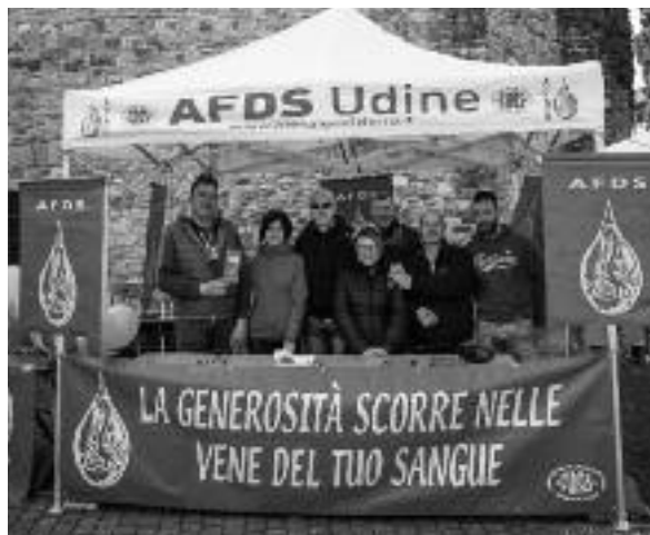
Lo striscione e lo stand della AFDS alla maratona Unesco in Aquileia