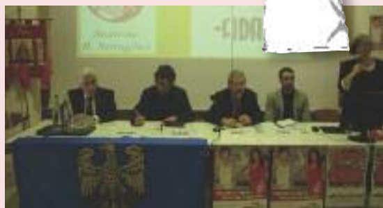
Un momento dell'assemblea e la maglietta consegnata ai giovani.

vecchi e nuovi donatori, sempre pronti a correre assieme in aiuto del prossimo. Novità dell'anno la "Cena con Delitto" in collaborazione con Anà-Thema teatro di Udine, che ha tenuto inchiodati alla sedia tutti i presenti fino allo scoprimento del colpevole. Tutte le informazioni sulla attività della sezione si trovano sulla pagina facebook accessibile a tutti, e prossimamente sul sito internet in fase di rinnovo.