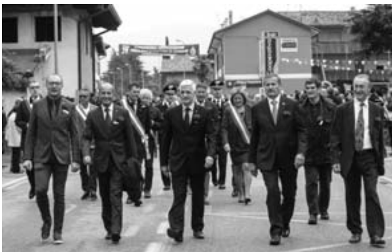
La “prima linea” congressuale