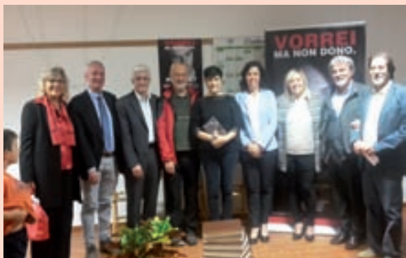
I relatori della serata

caroni che ha motivato l'incontro e ringraziato tutti presenti.