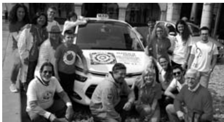
Un momento della manifestazione di Udine