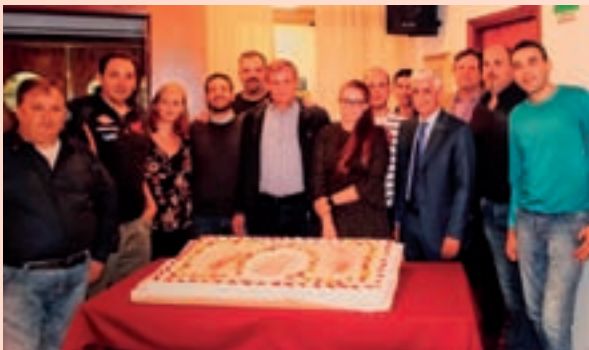
I collaboratori del congresso festeggiano l'evento