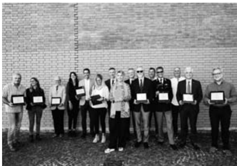
Le autorità partecipanti al Convegno

Questo messaggio fa breccia nella particolare sensibilità dei giovani e, in effetti, ne motiva la scelta. Non sarebbe, però, possibile giungere al dono se non ci fosse anche la figura dell'insegnante che ci crede, che stimola, che incoraggia, che offre esempi. È questo progetto volto, inoltre, anche ad avvicinare le giovani generazioni a tutto ciò che riguarda la salvaguardia della salute. Quindi, sarà fondamentale la collaborazione tra il mondo della scuola, della sanità, del volontariato e le istituzioni locali affinché il percorso formativo