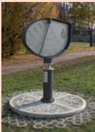
Il monumento al donatore