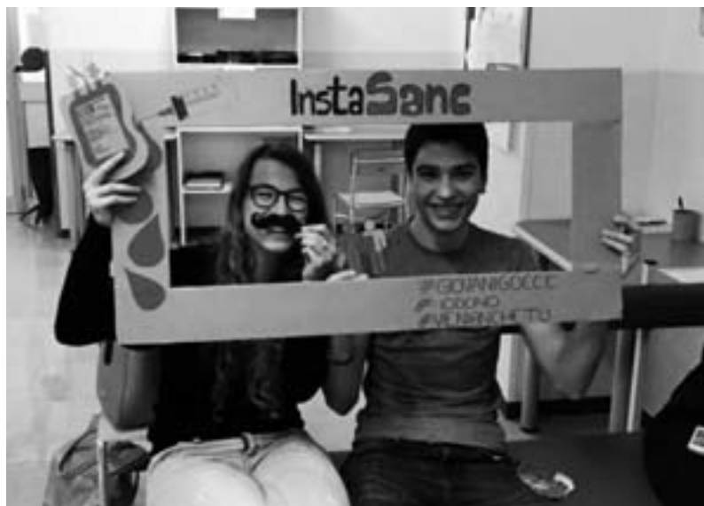
I giovani partecipanti all'iniziativa