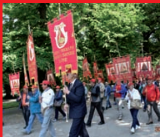
Ricordo del congresso di Milano