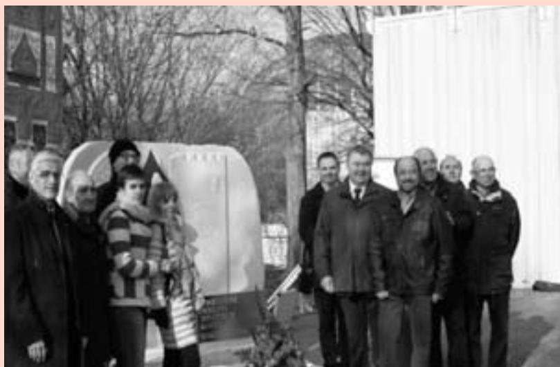
Inaugurazione del monumento al dono