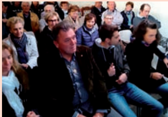
Serata sanitaria molto partecipata anche dai giovani a Camino al Tagliamento