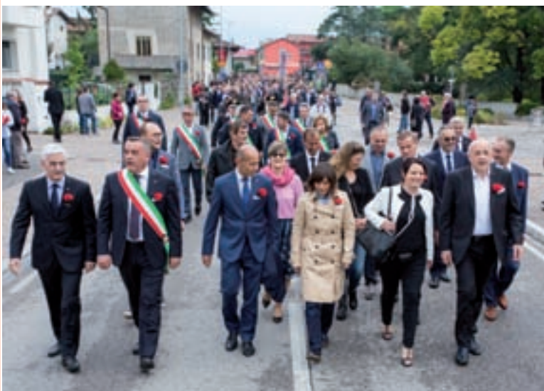
Le autorità al Congresso