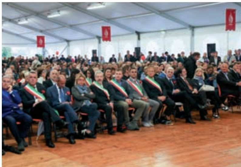
I Sindaci sono sempre una gradita presenza