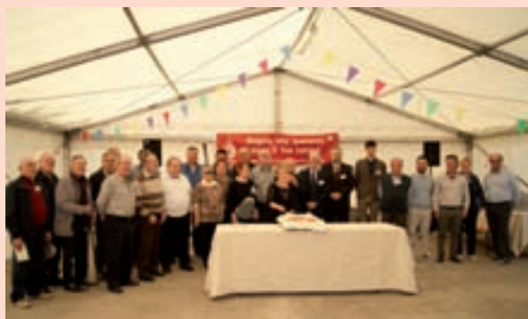
Un momento della giornata del Dono

Questa struttura si classifica terza come numero di donazioni subito dopo gli ospedali di Udine e San Daniele ed