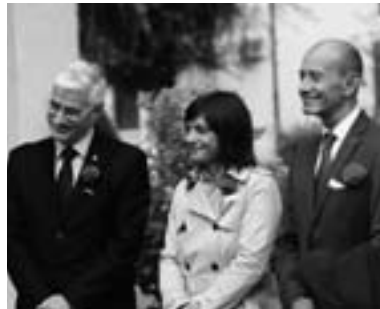
La Presidente Serracchiani fra il Presidente FIDAS Aldo Ozino Caligaris e Flora

cremento delle uscite, stiamo per entrare con persone volenterose e preparate nelle scuole elementari e medie, ci apprestiamo a rivitalizzare le zone e le sezioni ove introdurre nuove prassi di partecipazione e rinnovamento.”