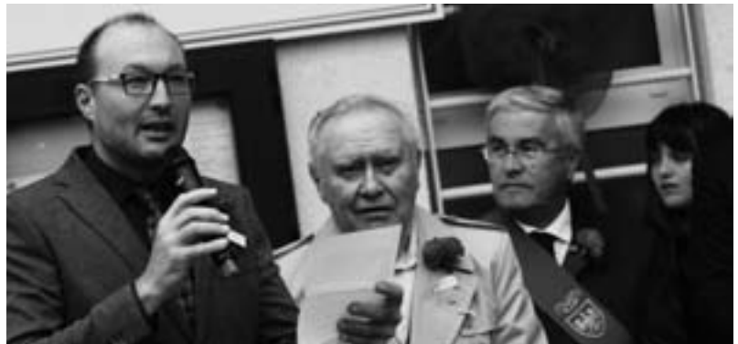
Inaugurazione della nuova sede di Premariacco

Abbiamo rilanciato il ruolo dell'autotemoteca, per la quale si chiede un in-